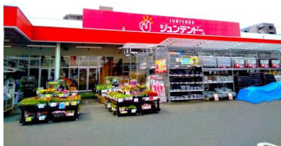
ジュンテンドー駅南店

対象店舗：ジュンテンドー駅南店（鳥取市南吉方2丁目30番地） 配達エリア：鳥取市中心部